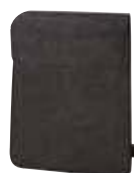
1808818 MODUL 1 ☐ 23