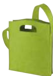
1807536 MODERNCLASSIC 29