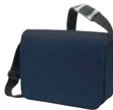
1807554 MODERNCLASSIC □ 15