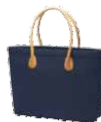
1809792 CLASSIC □ 28