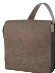
1807788 CONNECTCLASSIC ☐ 19