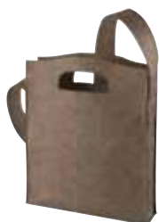
1807536 MODERNCLASSIC ☐ 29