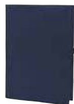
1809997 ECO □ 21