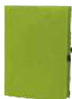
1809997 ECO 21