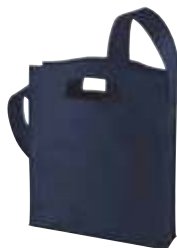
1807536 MODERNCLASSIC □ 29