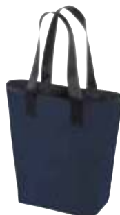
1805710 NEW CLASSIC □ 27