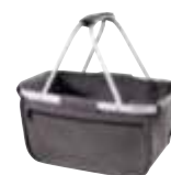
1808800 BASKET □ 31