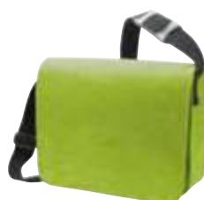
1807554 MODERNCLASSIC 15