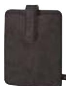
1808819 MODUL 2 ☐ 23