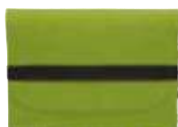
1809117 MODERNCLASSIC M 25