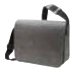
1807554 MODERNCLASSIC □ 15