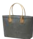
1809792 CLASSIC □ 28